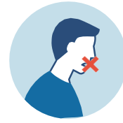
原因不明的 嗅覺喪失